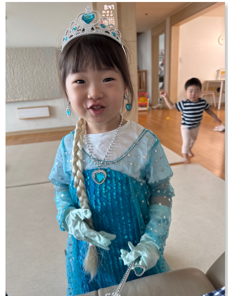
입이 쉬지 않는 레리고 공주님과 온동네 뛰어다니는 동네 아저씨